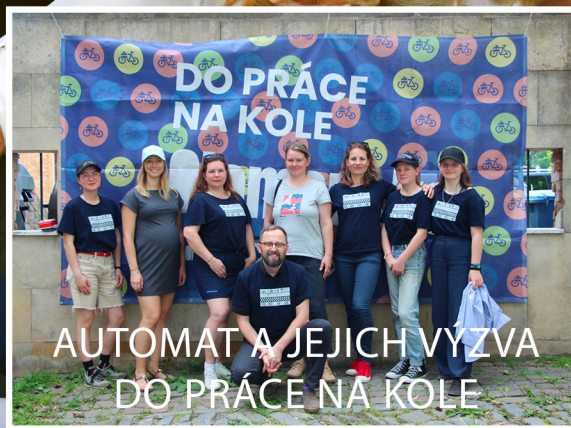
AUTOMAT A JEJICH VÝZVA DO PRÁCE NA KOLE