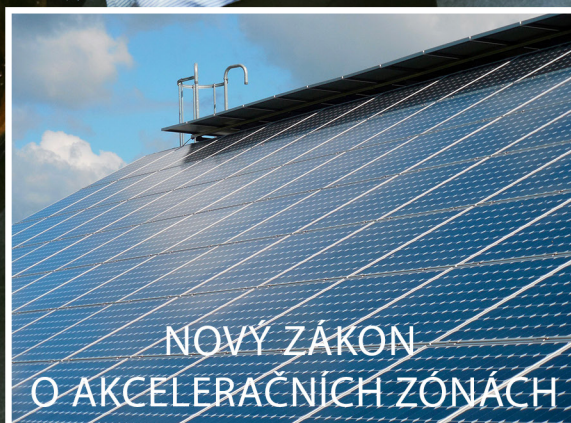
NOVÝ ZÁKON O AKCELAČNÍCH ZÓNÁCH