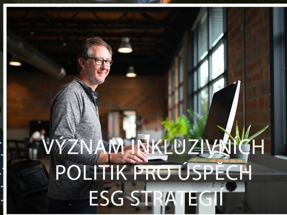
VÝZNAM INKLUZIVNÍCH POLITIK PRO ÚSPĚCH ESG STRATEGIÍ